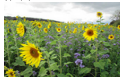
Herbstzeit in der Gemeinde Everswinkel.